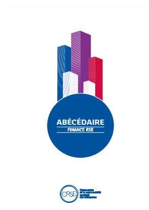
2018 Abécédaire finance & RSE