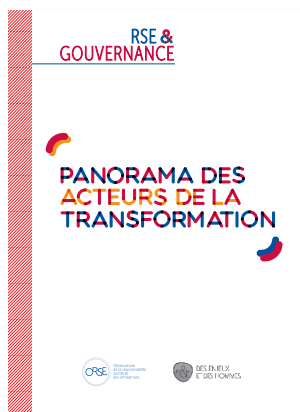
2018 RSE & Gouvernance : panorama des acteurs de la transformation