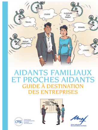
2017 Aidants familiaux