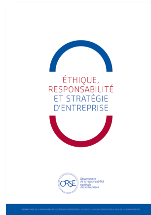
2017 Éthique et RSE