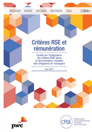
2017 Critères RSE et rémunération