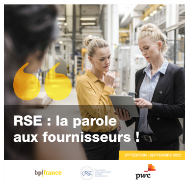
RSE : la parole aux fournisseurs ! - 2ème édition -