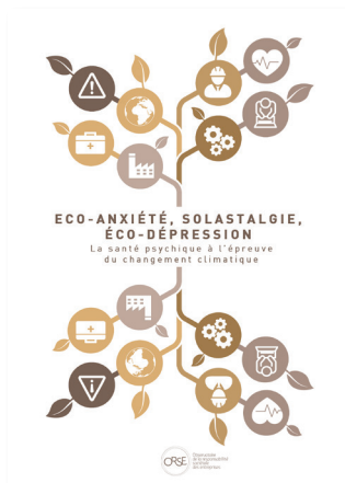
Eco-anxiété, solastalgie : La santé psychique à l'épreuve du changement climatique