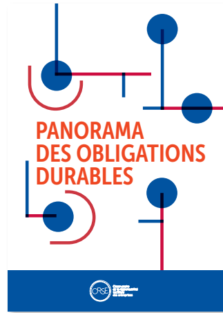
Panorama des obligations durables