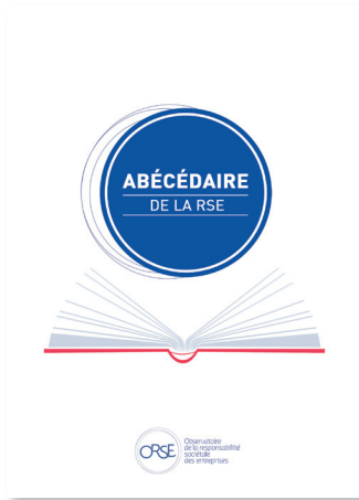
Abécédaire de la RSE