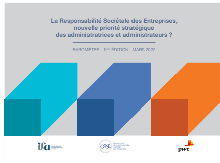
La RSE, nouvelle priorité stratégique des administratrices et administrateurs ?