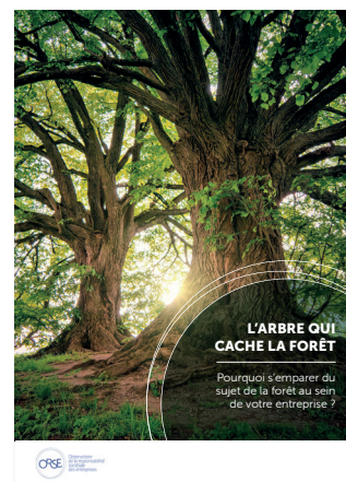
Guide des forêts L'arbre qui cache la forêt