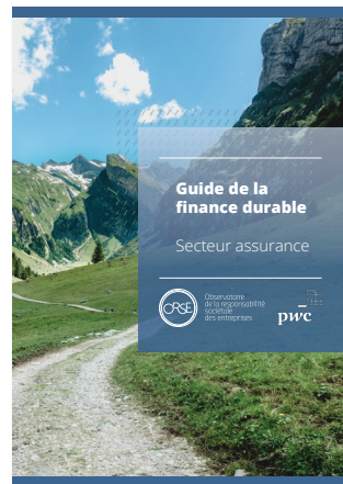
Guide de la finance durable Secteur assurance (réglementation)