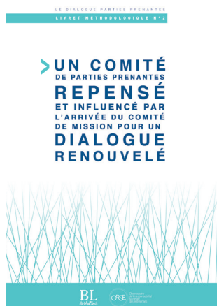
Dialogue parties prenantes Livret 2