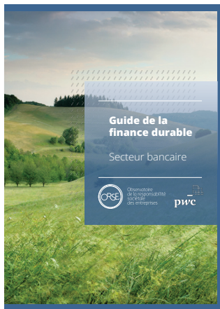
Guide de la finance durable Secteur bancaire (réglementation)