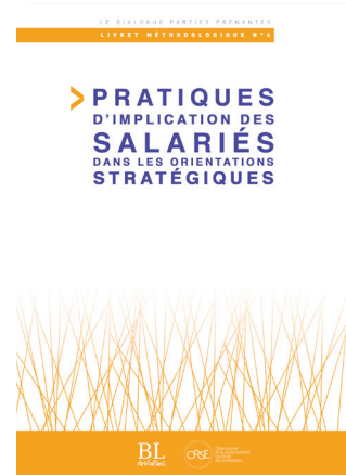
Dialogue parties prenantes Livret 4